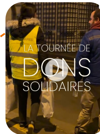
Samusocial de Paris