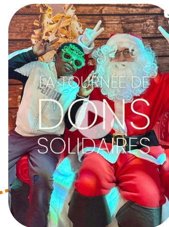
Centre social Etincelles Paris