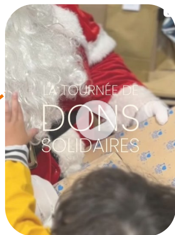
SOS Bébés Mamans Lille