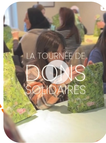
Le Parcours Strasbourg